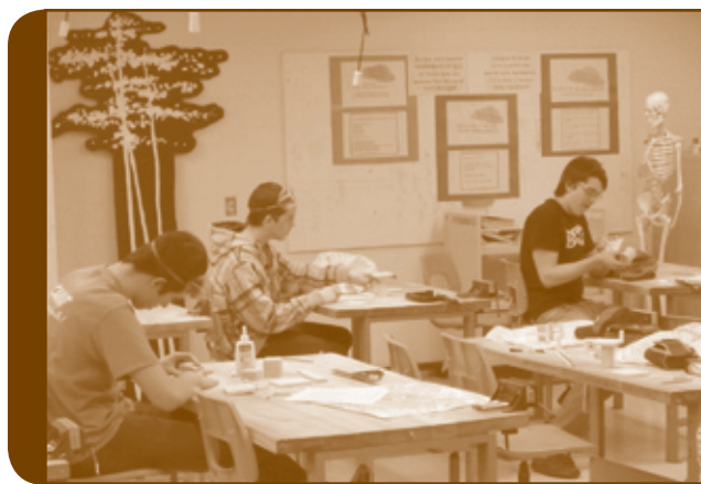
Laboratoire de science

Des investissements majeurs ont aussi été nécessaires suite à l'implantation des nouveaux programmes au secondaire. Les réaménagements de différents locaux ont nécessité une dépense de 150 000 $. Plusieurs investissements restent encore à faire pour compléter les aménagements requis.