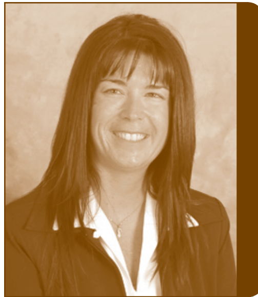
Directrice des ressources humaines et de l'adaptation scolaire

Deux contrats d'engagement surnuméraire d'agente de réadaptation, un contrat régulier à temps partiel d'une conseillère en orientation, un contrat en suppléance d'une conseillère en éducation préscolaire, deux contrats en suppléance de conseillère pédagogique, un contrat régulier temps plein d'une psychoéducatrice et un contrat régulier temps plein d'une conseillère pédagogique. Un contrat de service a été signé avec une psychologue.